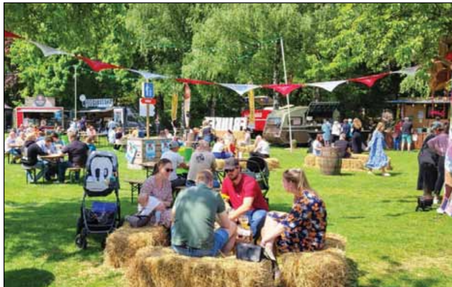
Het park biedt kansen voor mooie evenementen. Vaker doen!

We willen ook meer leuke dingen in het stadspark organiseren. Het park biedt zóveel kansen, er moet véél meer te doen