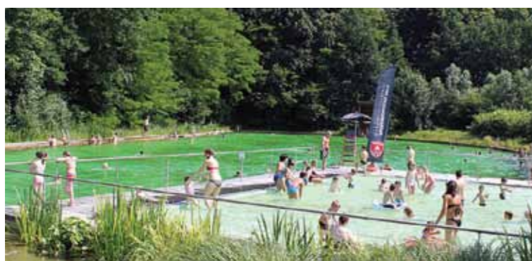
... of een zwembad. (Of allebei!)