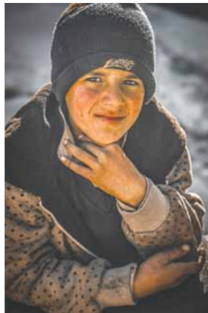
Al meer dan 27 procent van de leefloners is jonger dan 25.

We lanceren ook een nieuw idee om generatiearmoede een halt toe te roepen. Van een gezin in generatiearmoede weten we dat de kinderen ook arm zullen zijn en hun kinderen ook. Naast de menselijke tol eist dit een hoge prijs van de maatschappij. Immers, die kinderen en kleinkinderen moeten in de toekomst ondersteund worden. De gedachte dat zo'n gezin met één grotere investering, waardoor het schuldenvrij wordt en zich een aanvaardbare levensstandaard kan permitteren, en een intense begeleiding