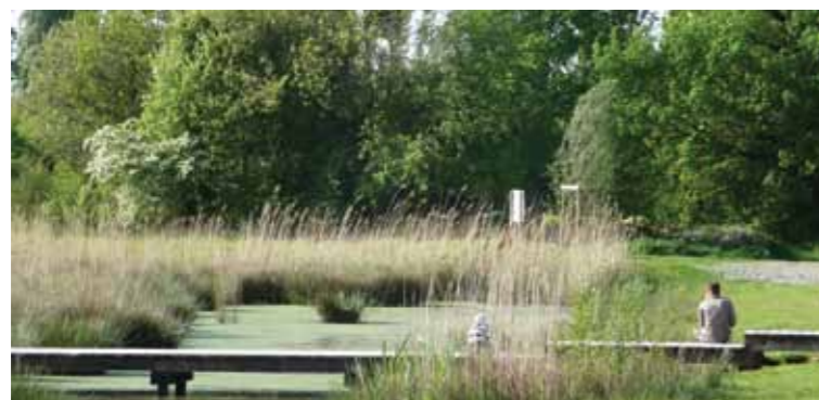
Een waterpartij moet er in Domein Kievermont zeker komen. Of het nu een natuurvijver is...

Het domein Kievermont is van ons allemaal, we betaalden er 6,5 miljoen euro voor. Maar wat gaan we er mee doen? Het stadsbestuur valt terug op een oud provinciaal ruimtelijk uitvoeringsplan dat zowat 20 jaar geleden al een compromis was en zelfs als argument moest dienen om de Ring door te trekken. Vandaag geeft de meerderheid toe dat dit PRUP achterhaald is, maar een nieuw idee is er nog niet. De Brugpartij ziet in het domein een fantastische kans om het leven van elke Gelenaar een belevingsvolle meerwaarde te geven.