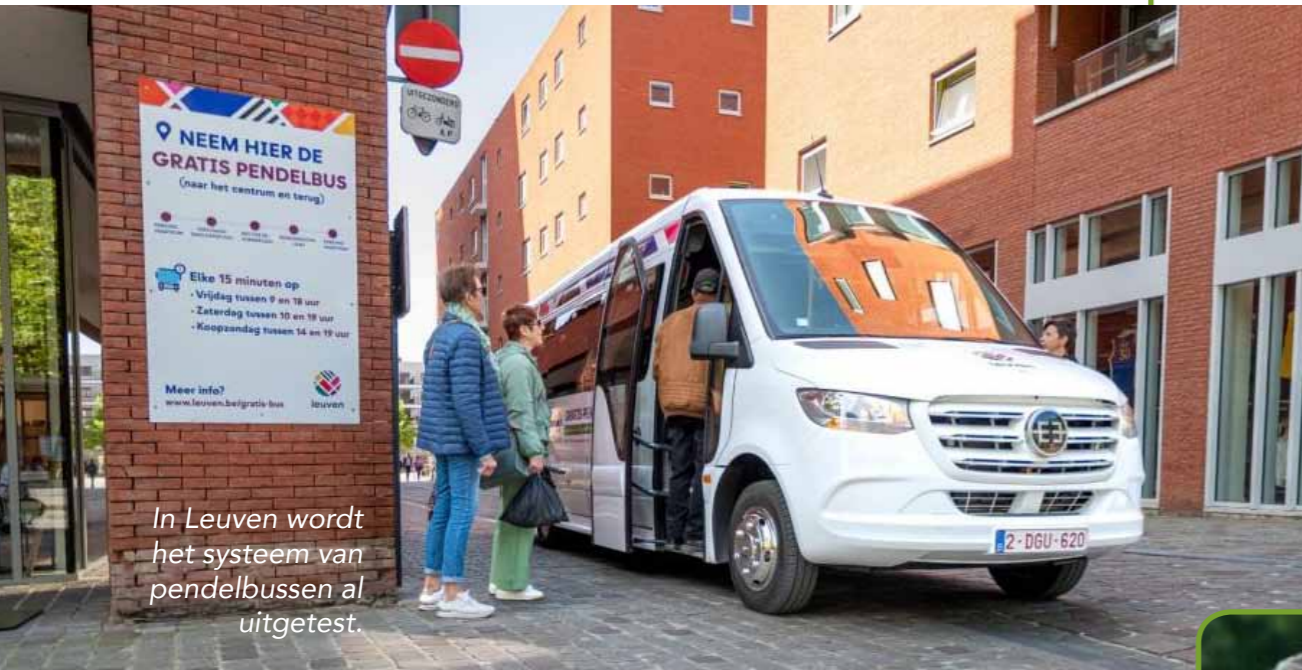
In Leuven wordt het systeem van pendelbussen al uitgetest.

De Brugpartij wil in Geel een klein openbaar stadsnet laten rijden: de Gele Lijn. Dat zou bestaan uit pendelbusjes die de Geelse dorpen met het centrum verbinden en hun nut ook bij grotere evenementen in het centrum zullen bewijzen. Een betaalbare alternatieve vorm van openbaar vervoer voor iedereen, kortom. De middelen die via de Vervoerregio ter beschikking staan voor het 'vervoer op maat' kunnen hiervoor gebruikt worden, aangevuld met stedelijke middelen en subsidies.