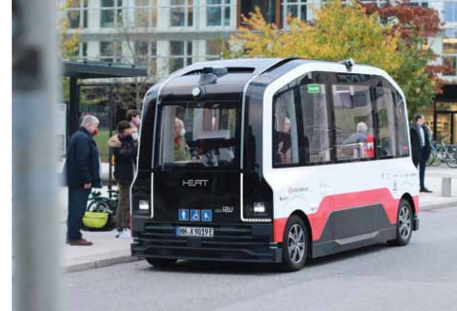
Als de Brugpartij aan pendelbussen denkt, gaat het natuurlijk liefst om elektrische voertuigen.

Met de fiets of de Gele Lijn naar het centrum komen, kan voor iedere Gelenaar een optie worden. Het is geen droom, maar een voorstel dat met wat politieke moed het leven van elke Gelenaar veel aangener kan maken