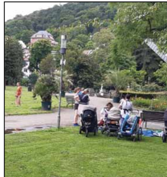
Een ontmoetingsplek voor alle generaties., zoals hier in Freiburg.

Het stadspark kan écht een aantrekkingspool worden voor alle generaties. En stel dat er dan voldoende volk komt om een foodtruck met koffie of een krantenkiosk rendabel te maken... Zalig!