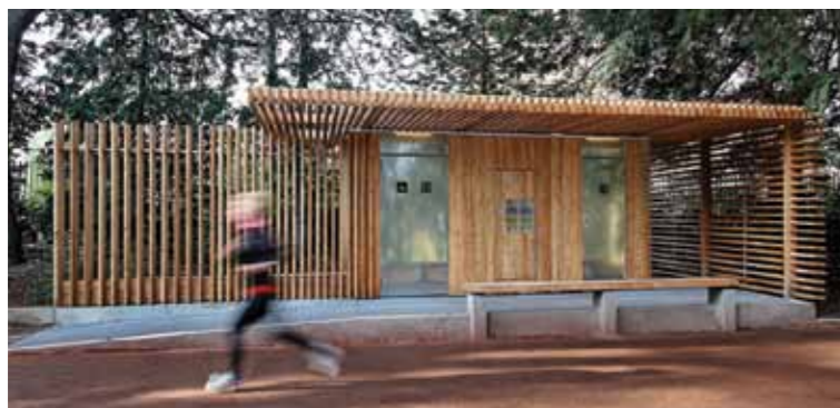
En misschien moeten we daar eens een dégelijk openbaar toilet zetten.

Eén derde recreatie, één derde natuur en één derde KMO-zone. Dat is al twintig jaar het plan voor het domein Kievermont. KMO-zone?! Daar is niet de minste behoefte meer aan, zeker niet op die moeilijk bereikbare plek. Of moet al dat verkeer weer door Sint-Dimpna? En recreatie en natuur, oké... maar maak er dan werk van!